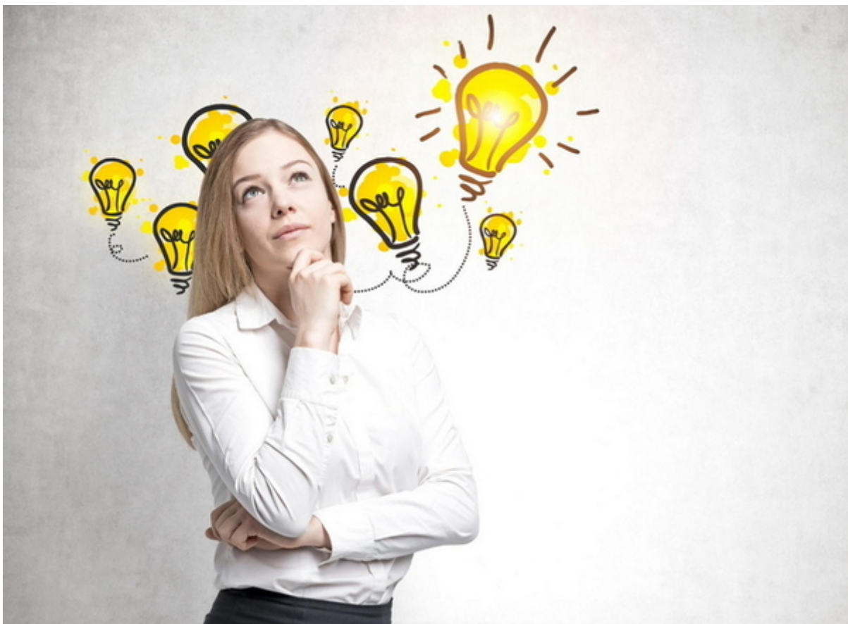
Vielen Ideen im Kopf brauchen ein System, eine Struktur um zum Erfolg zu führen

...dabei hilft und unterstützt Sie auch Ihr "Vorsorge-Coach"