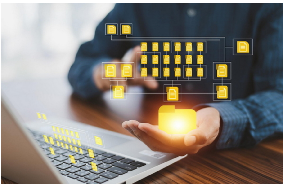
Weitere Amicas Online Serviceportale aus der existenziellen Lebens- und Vorsorge-Planung