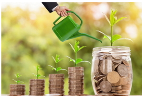
Serviceportal "Renditestarke (Alters-)Vorsorge"